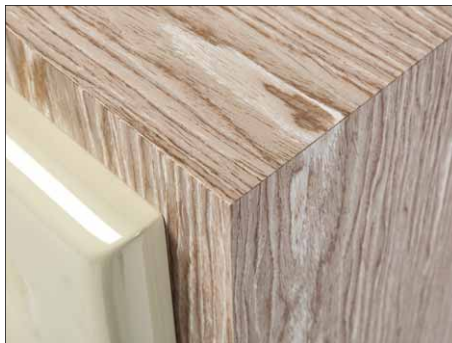
Das Gehäuse, in das die Polymerbeton-Front eingesetzt ist, hat eine Wandstärke von 38 mm und ist perfekt verarbeitet