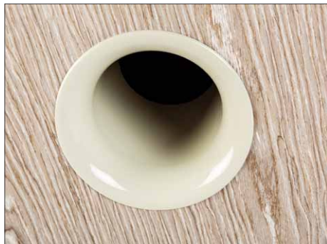
Das 10-cm-Bassreflexrohr ist in derselben Farbe wie die Front lackiert