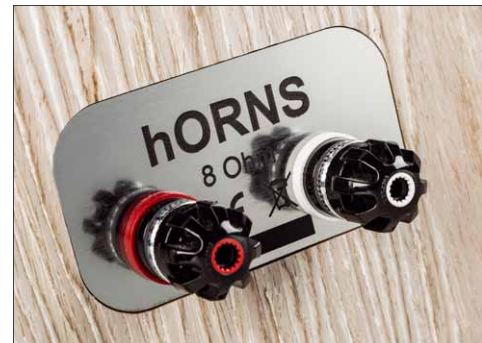
Die Anschlussklemmen kommen standesgemäß von WBT

Die Horns FP12 ist in vielerlei Hinsicht ungewöhnlich. Da sind vor allem erst mal die Proportionen. Während das Gros der lautsprecherproduzierenden Welt schlanke, hohe Säulen auf den Markt bringt, wirken die Horns mit 443 x 655 x 417 mm Breite x Höhe x Tiefe ausgesprochen stämmig. Das Format erinnert eher an klassische englische Monitore als an moderne High-End-Lautsprecher. Aufgrund der Höhe gehören die FP12 auf Ständer, damit die Hochtonhörner auf Ohrhöhe kommen.