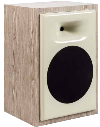
Bei den Furnieren und der Farbe der Front hat der Kunde fast freie Wahl. Das Schöne ist, dass es viele Variationen ohne Aufpreis gibt