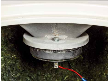
Der 1"-Horntreiber mit Alu-Membran ist un-mittelbar an das gegossene Horn angeflanscht