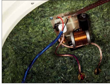
Die Frequenzweiche trennt die beiden Chassis mit 12 dB bei 1200 Hz und kommt mit wenigen hochwertigen Bauteilen aus

Auch die Abbildung ist eindrucksvoll. Einerseits bilden sie das Geschehen etwas größer und näher ab als viele audiophile Boxen, andererseits überfallen sie einen weder mit der krassen Nähe noch der über-großen Abbildung, mit der viele Hochwir-kungsgradlautsprecher auf normale Hör-distanz Nahfeldfeeling aufkommen lassen. So funktioniert auch Klassik toll. Ja, ich bin näher dran als üblicherweise bei HiFi-Boxen, trotzdem ist der Raum tief und weit.